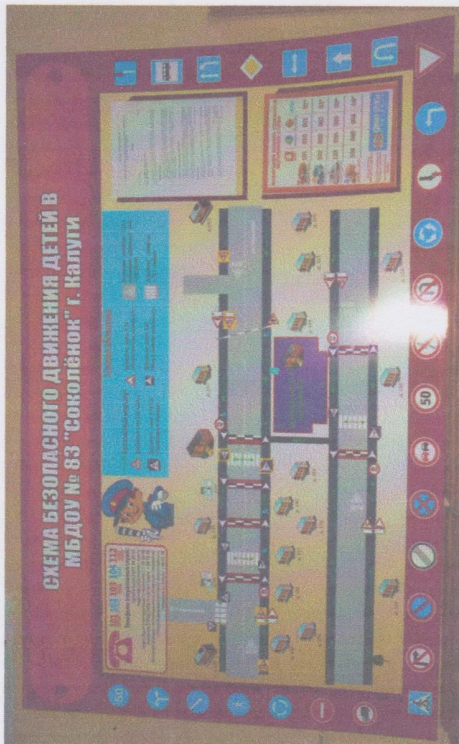
фото на странице: 3