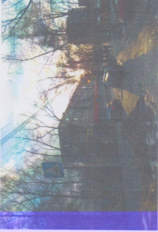
Фото на странице: 9

Подход к МБДОУ №83 г. Калуги с ул. Баррикад, со стороны ул. В. Андриановой